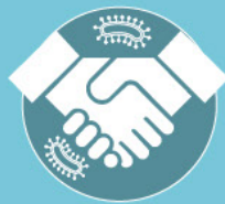
de manière directe

Il est recommandé de ne pas se couvrir la bouche et le nez avec la main car les microbes déposés sur la main peuvent se transmettre à d'autres personnes :