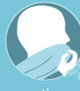
un tissu (écharpe, manche...)